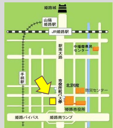
姫路市総合福祉会館 地図 (姫路市役所 西)